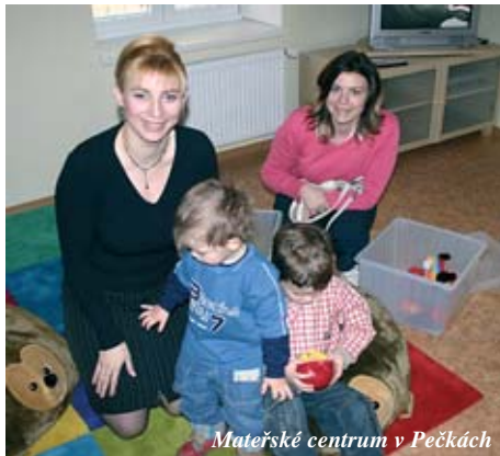
Mateřské centrum v Pečkách