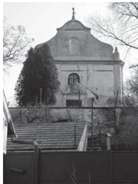
V Pečkách 1.1.2006

• Obecní úřad obnovil rozesílání SMS zpráv občanům. Kdo má o tuto službu zájem, nechť svoje číslo nahlásí na OU.