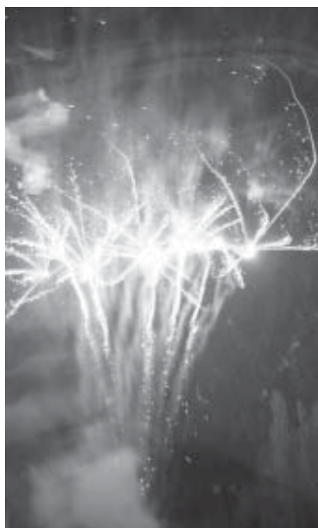
Oslavy 85. výročí založení Československé republiky v Cerhenicích