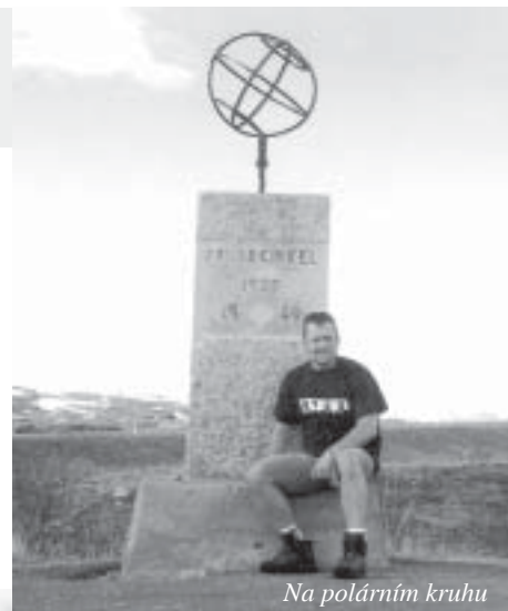
Na polárním kruhu