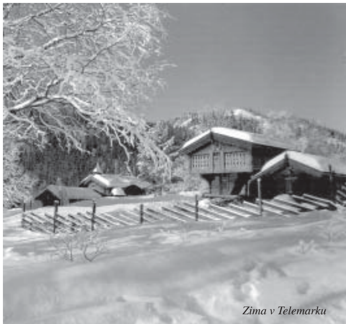
Zima v Telemarku